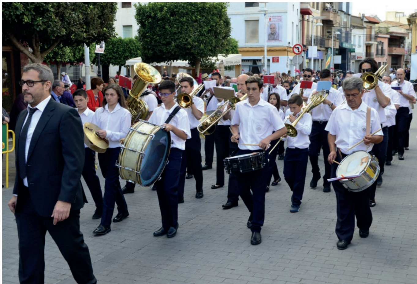
Trobada de bandes de La Ribera a Alginet 2019.