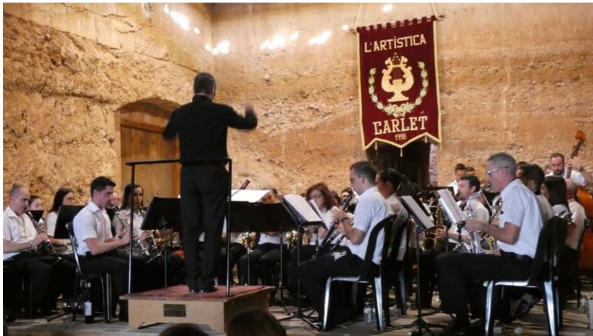
Concert de vi a Moixent