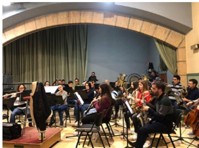
Assaig a la seu