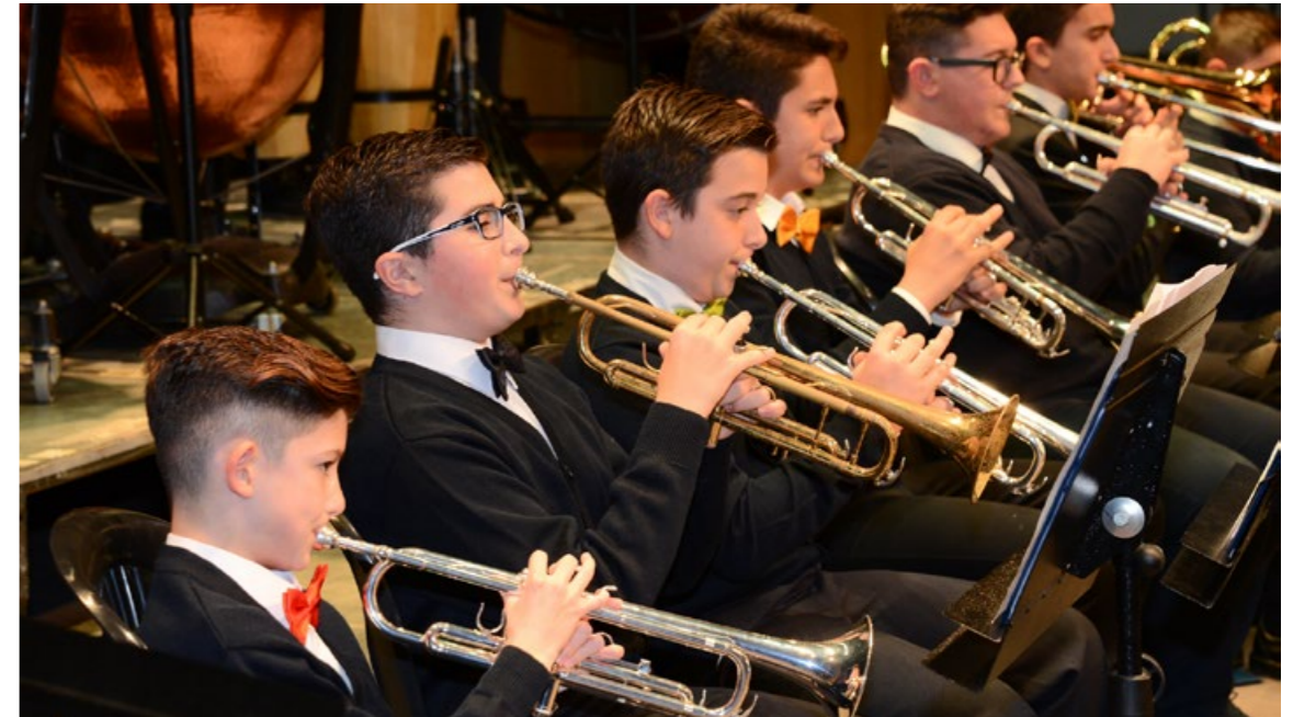
Concert de Nadal 2018