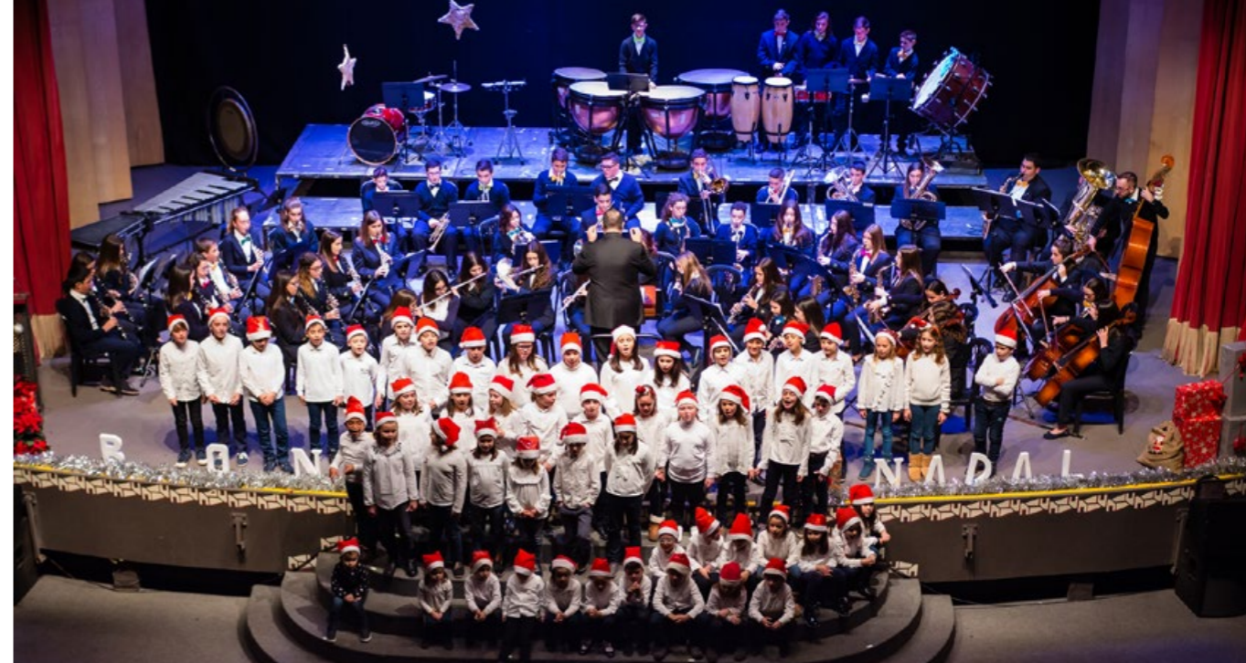
Concert Nadal 2018