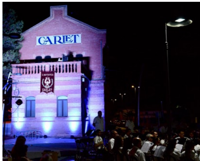
Concert de vi "Celler de Roure"