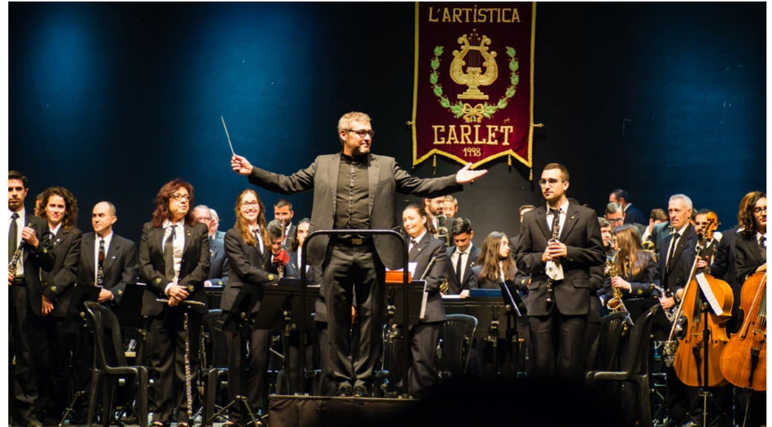
Concert d'hivern 2019