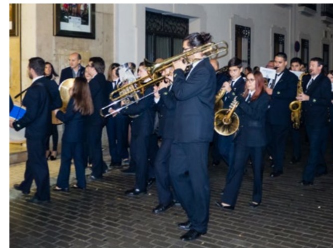
Santa Cecília 2018