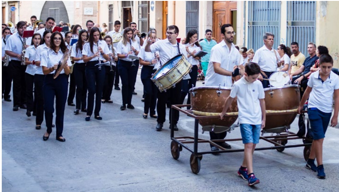
Desfilada Moros 2019