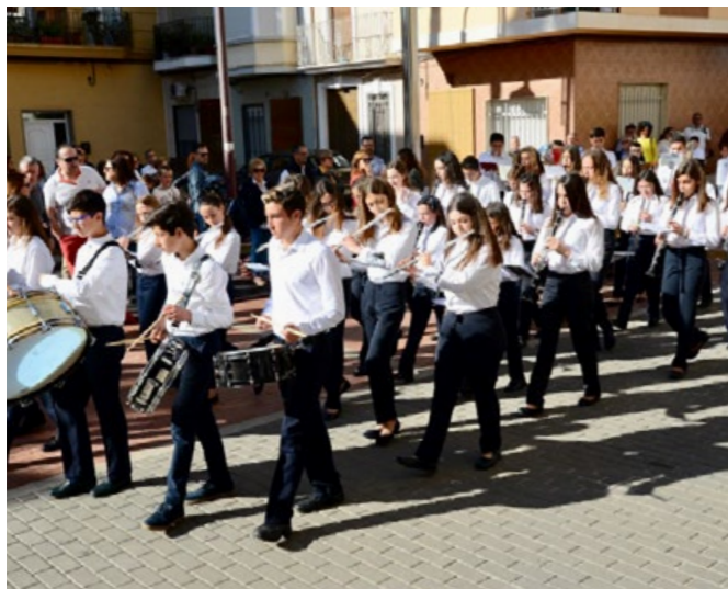
Festival de Bandes Juvenils 2019