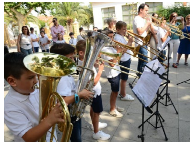
Audicions al carrer